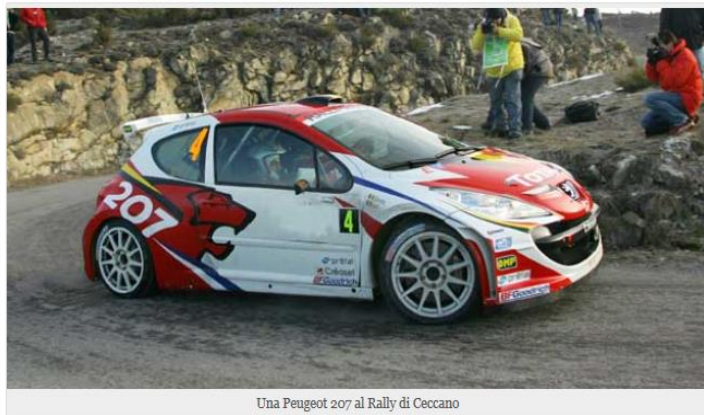
Una Peugeot 207 al Rally di Ceccano

CECCANO (FR) - E' iniziato il conteggio alla rovescia e manca meno di una quindicina di giorni al 29° Rally di Ceccano in programma il 18 - 19 Luglio sulle strade intorno alla catena dei monti Lepini.